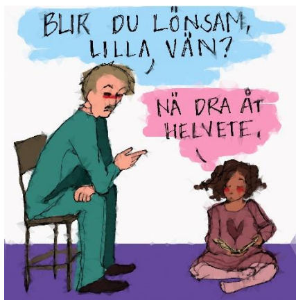
Illustration: Agnes Lundgren